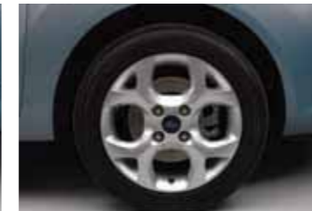
Titanium Standart 15" alüminyum alaşımlı jant