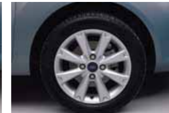
Sport Standart 15" alüminyum alaşımlı jant