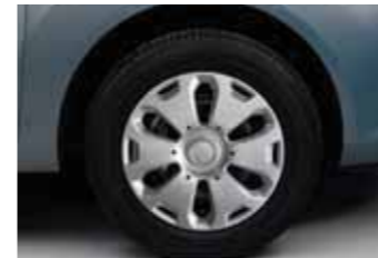
Trend Standart 14" jant kapağı